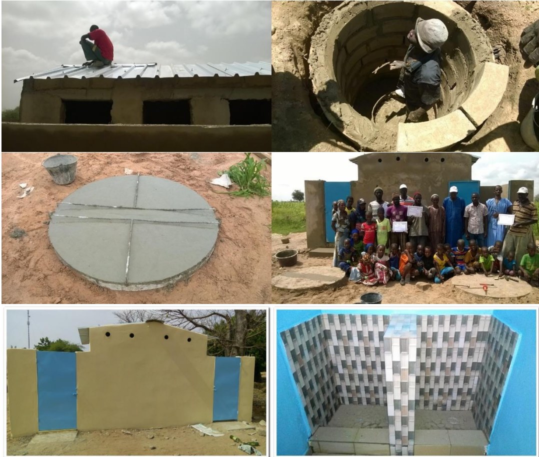
Photo 6 : Les différentes étapes de la réalisation d'ouvrage avec les maçons