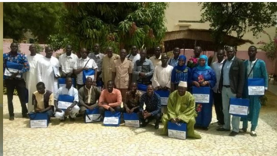
Photo 5 : à gauche les enseignants de Louga et à droite les enseignants de Thiès