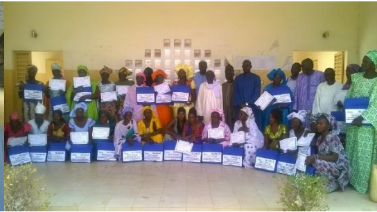
Photo 4 : Cérémonie de clôture et photo de famille